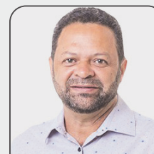
Roberto do Eleven (Republ)